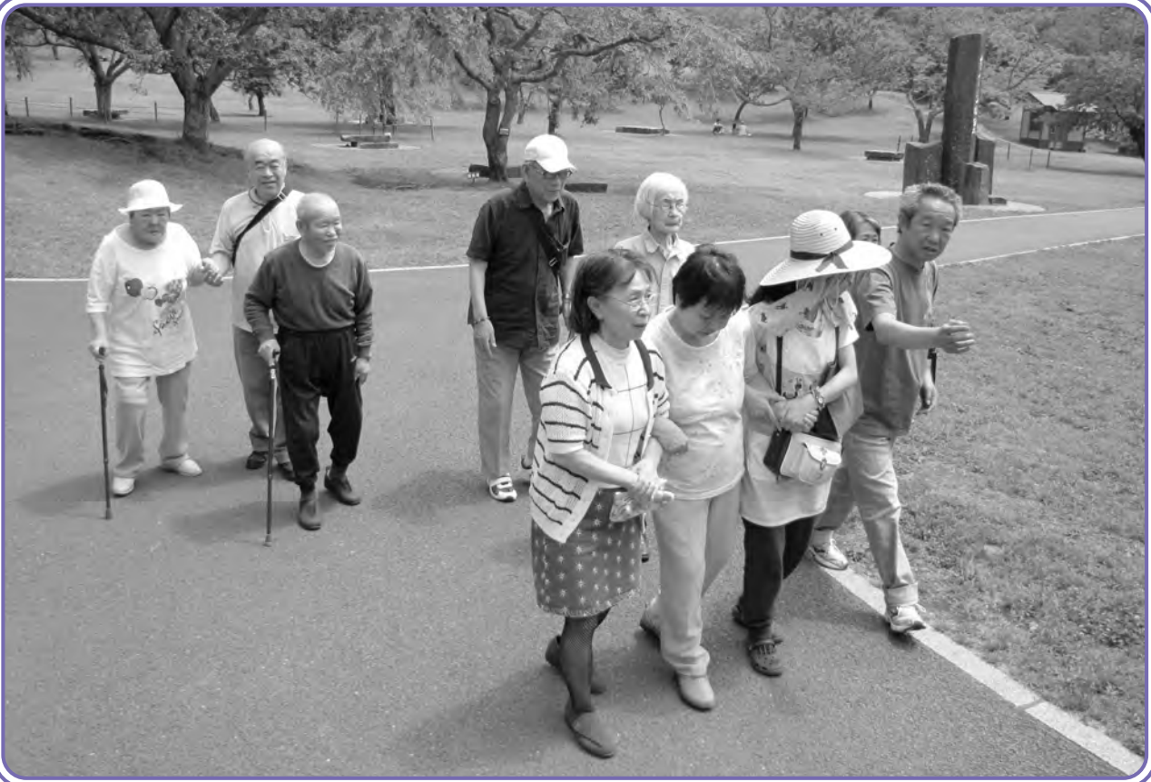
養護老人ホーム「平和の杜」 お弁当を食べに満開の「さくらの里(大室山)」へ

住所: 〒431-1304 静岡県浜松市北区細江町中川 7220-11 tel 053-414-1400 fax 053-420-2100