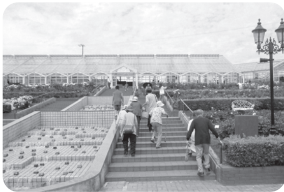
島田市ばらの丘公園へおでかけ (げんきプロジェクト根洗荘)

物ツアーなどの送迎にも使われています。アドナイ館に入居されている方の手作りカーテンが掛けられるなど長年愛されてきましたが、年々痛みも激しくなり、とうとう雨漏りもするようになってしまいましたので、この度新しく購入を検討することとなりました。