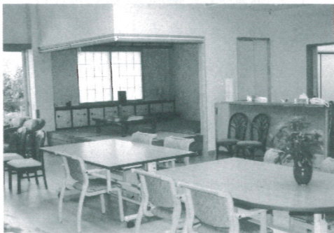
デイサービスセンター みをつくし（E型）