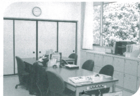
ヘルパーステーション ほそえ