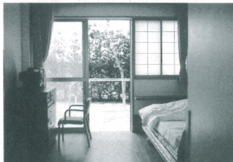
ショートステイ居室（個室8、2人部屋2、4人居室1）