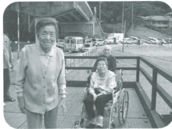
雲見海岸でお散歩