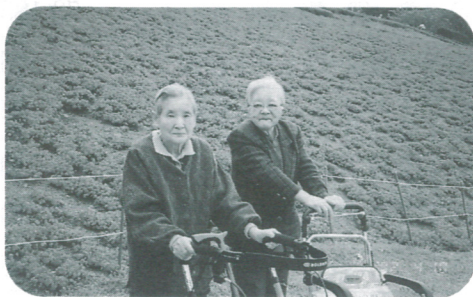
今年の ▶ 松崎桜

最後になりましたが、居宅介護支援事業は、利用者との関わりより、家族との関わりが多く、その所で課題を残しましたが、それを次の年へのステップとしてがんばっていきます。