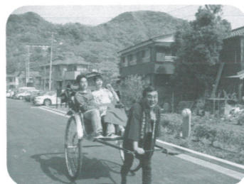
人力車の出張サービス