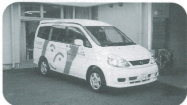
送迎支援車(日産セレナ8人乗り)

このたび、日本財団の2001年度福祉車両助成事業による助成金の交付を受け、送迎支援車(日産セレナ8人乗り)をいただき、デイサービスの送迎に有効に使わせていただ