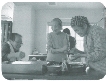
ドライブに備えて ～おにぎりづくり～