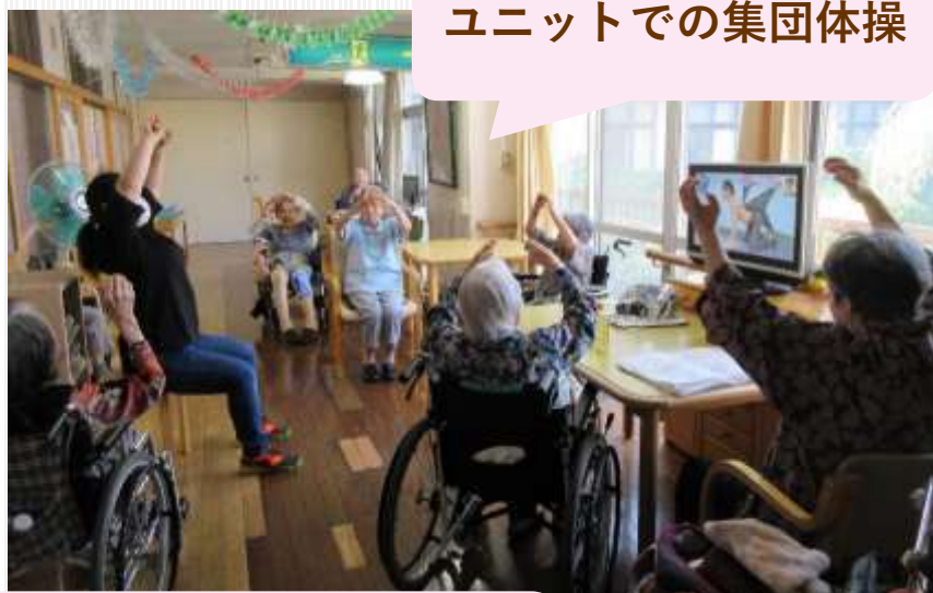
ユニットでの集団体操

理学療法士と介護職員と一緒に歩行訓練。普段の生活の中でその方に合う内容を取り入れ、自然に身体機能維持につながるよう取り組んでいます。